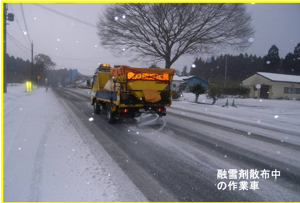
融雪剤散布中の作業車

また、除雪作業や融雪剤散布の低速作業車が走行するため、皆様にはご迷惑をお掛けしますが、ご理解・ご協力をお願いします。