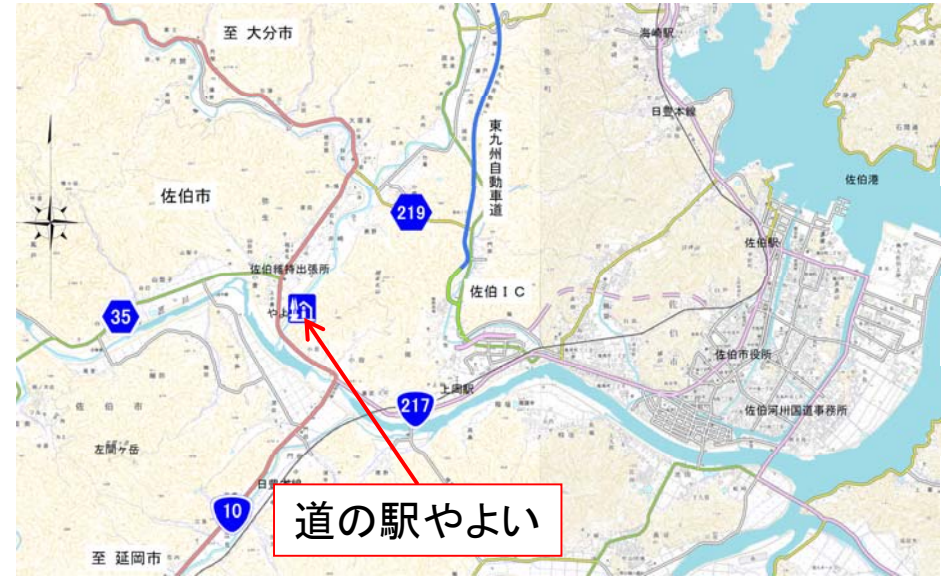
▲道の駅「やよい」位置図