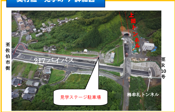
奥村組 見学ステージ詳細図