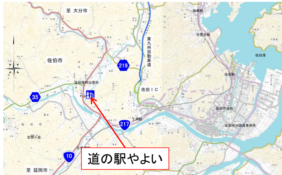
▲道の駅「やよい」位置図