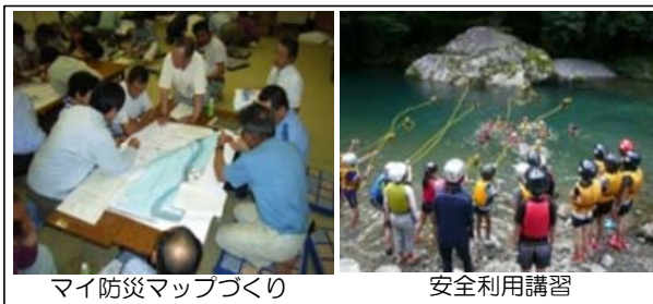
マイ防災マップづくり