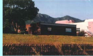
市民団体による活動拠点の整備事例（佐波川）

※ 河川管理者から河川管理施設の維持、除草等の委託を受けることも可能となります。委託先については、公募等の適正な手続きを経て選定を行う予定です。