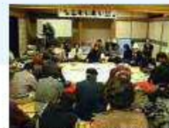
わいわい懇の開催による地域資源の発掘