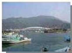
マリカルチャーセンター