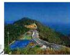
豊後くろしおライン