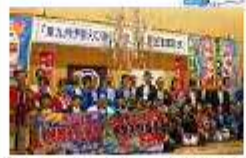
観光キャンペーンなどによる県境を越えた地域連携