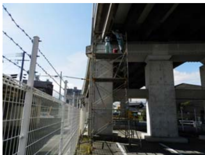
足場設置による点検