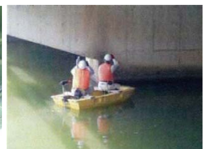
小型船舶を使用した水上での点検