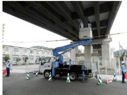
リフト車による点検