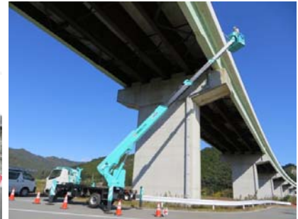
高所作業車による点検