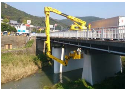
橋梁点検車による点検

・特殊点検車両や船舶等で、ふだんは見えない所も近づいて技術者が近接目視点検しています。