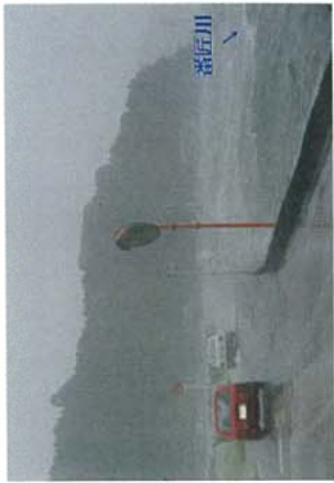
↑平成2年（台風14号）浸水状況

■番匠川河口部の右岸に位置する灘地区は、堤防が未整備であり、昔から洪水及び高潮による浸水被害が頻発していた地区でした。また、河岸に沿ってカーブが連続する県道は、道幅が狭く、見通しも悪い状態でした。このため、洪水及び高潮に対する災害防止対策として、堤防整備を平成4年度から着手し、県道の改良事業と一体的に整備を行い、平成28年3月に完成しました。