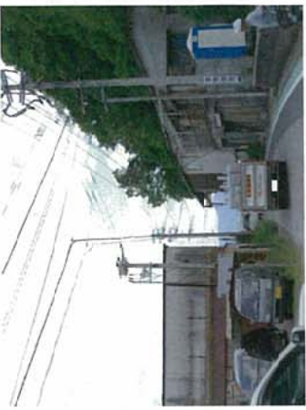
↓道幅が狭く見通しが悪い道路