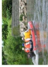
船による河岸の情報収集等