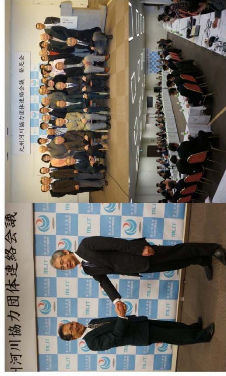
九州河川協力団体連絡会議 発足会