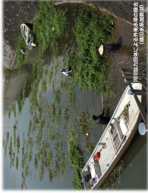
河川協力団体による外来水草の除去 (緑川水系加勢川)