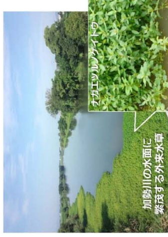
加勢川の水面に繁茂する外来水草