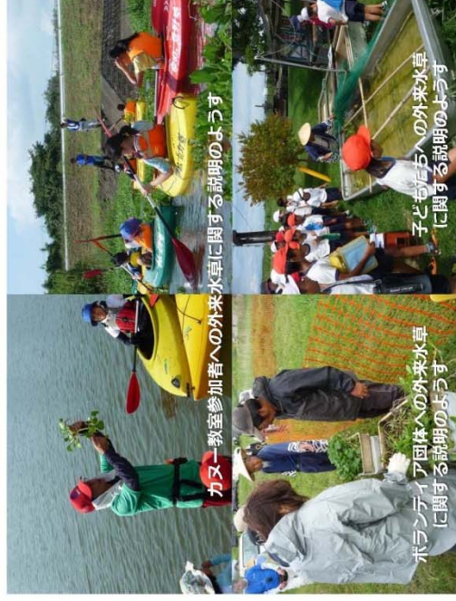
カヌー教室参加者への外来水草に関する説明のようす

加勢川では、主にブラジルチドメグサ、ナガエツルノゲイトウ、ポタンウキグサなどが確認されています。