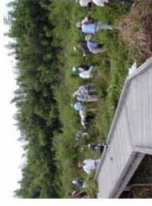
ビオトープの整備