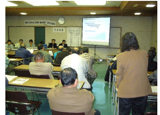
開催状況イメージ