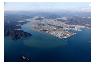
番匠川の河口付近