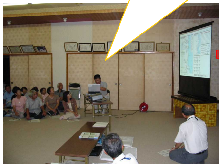
蛇崎地区住民の方々約60人 が説明を聞いています。