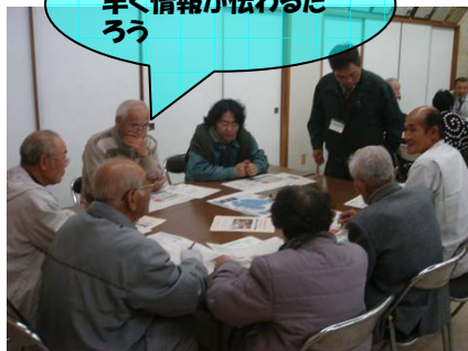
各班ごとに災害時の連絡網を作成しています。