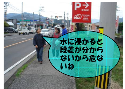
町歩きで危険箇所の抽出

また、今回の検討会では、防災知識の向上の為、「排水ポンプ場の役割」、「川の警告灯の設置」についての説明を佐伯河川国道事務所から行い、さらに、佐伯市からは、「自主防災組織」「土地利用規制」についての説明がありました。住民の方からは、今後自主防災組織を設立し、避難訓練の実施など継続した活動を行いたいという意見が出ました。今後も市や住民と協力しながら、防災まちづくりの支援を行っていききたいと思います。