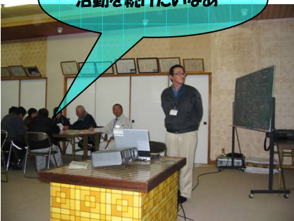
蛇崎地区住民約40名の方が、説明を聞いています。