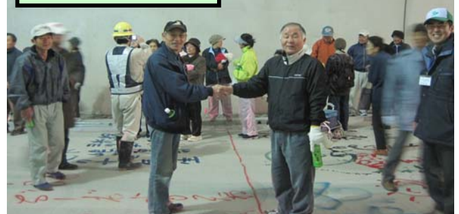
両区長さんによる握手