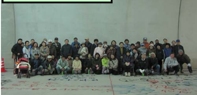
両地区の皆さんで記念撮影