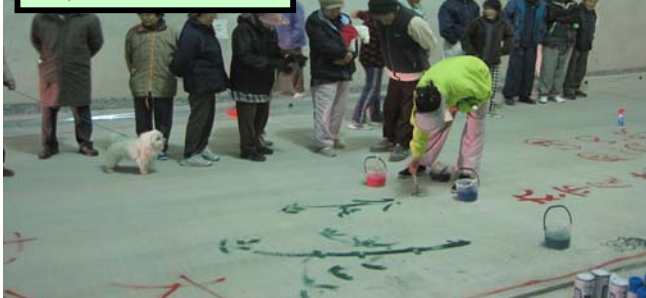
舗装版へのお絵かき