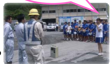
▲生徒代表お礼のあいさつ

今回、参加された生徒さんが、車の免許を取得し、東九州道を通行する際は、この見学会のことを思い出してほしいものです。