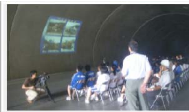
▲工事概要説明 (トンネル壁面のスクリーン)