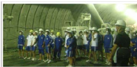
▲トンネル坑内見学