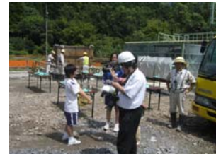
▲NHKの取材(6時のnewsで放映されました)