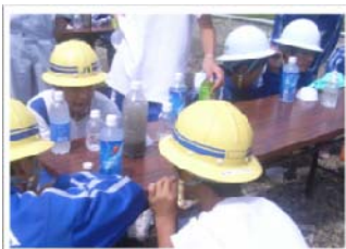
▲濁水処理実験の様子