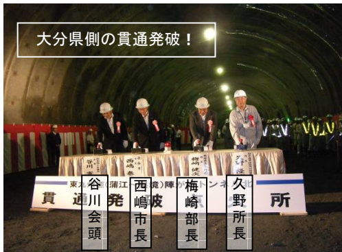
大分県側の貫通発破！

式典後は、マウンド上や会場各所でお互いの労をねぎらったり、肩を組んでの記念撮影なども行われ、たくさんの方々の記憶に残る貫通報告会になりました。【今後は、1日でも早い供用に向け頑張ります。】