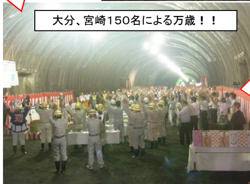
大分、宮崎150名による万歳！！