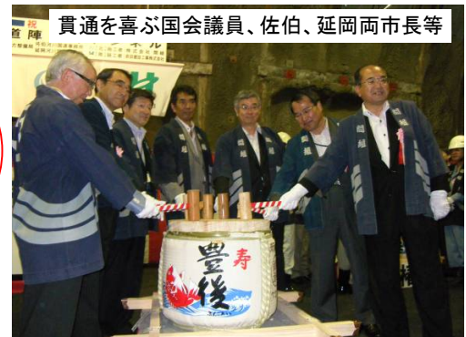
貫通を喜ぶ国会議員、佐伯、延岡両市長等