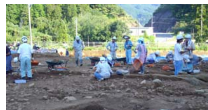
写真上:発掘状況 写真右:集石遺構

せではら 物リ文とて調遺 て落、室落 五大在 んしどと森がを土き赤理構縄いは一町跡今日分し森 かよのれの出磨器にく場が文ま、八時が回か県、ノ 。うよる木土りや使など確時す。早世代見のら教大木 か。う石遺しつ石用つし認代。期紀(一)か査掘庁川跡 にも跡てぶのさててさ早(約)の四つで調埋左は、 みし見のいす矢れい使れ期。一もく、ては、査蔵岸 なてつ石ま凹じたる用まの。万の一年と五、り中開化河伯 さこか材す。石・形のた。た。構。前推世、世始財岸市 もらて、や土やもも。は、(定)紀中、くしセ段大宇 いのい大分石り円りで石右のさ、世近、く、世し、 つ石ま分な用形まあ遺写もれ、く、世、江、近、と、 し材す。姫島や、た石文、は、の、江、近、と、 よを。考に時や、さ・の、た、熱、縄、う、文、な、 え入の人賀、の、ン、の、そ、受、人、集、 みたた。遺グ縄のけが石