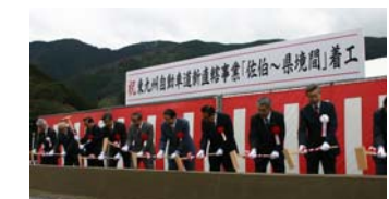
着工式 平成19年2月18日 (於:青山橋)