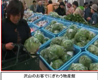
沢山のお客でにぎわう物産館