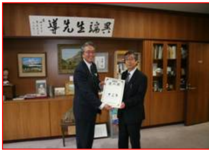
道の駅の登録書を交付(H22.3.4)