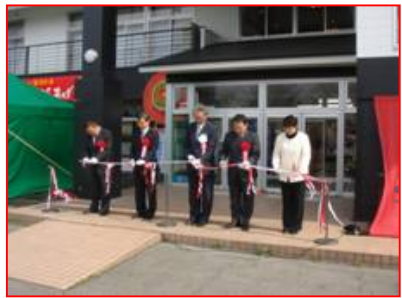
テープカット(中央:竹田市長、中央左:世利所長)