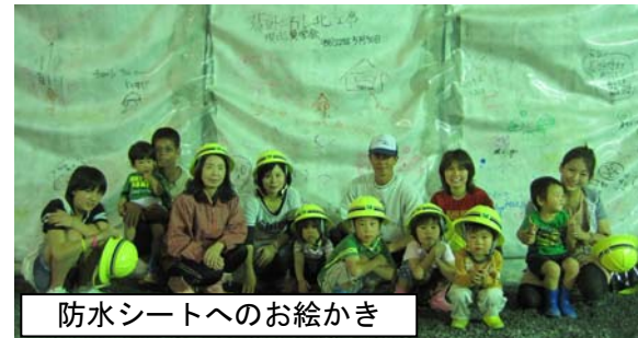
防水シートへのお絵かき

新直轄事業とは、料金収入で管理費が賄えない路線など整備が難しいと見込まれる区間において、国と地方の負担で高速道路を整備する新たな直轄方式です。通行料金は「無料」になります。