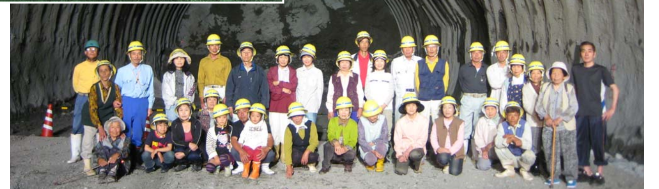
切羽前での記念撮影