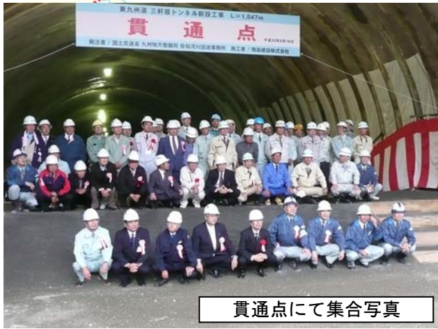
貫通点にて集合写真

三軒屋トンネルは佐伯～蒲江間では最初の貫通となり、佐伯～県境間では2番目に貫通したトンネルとなります。