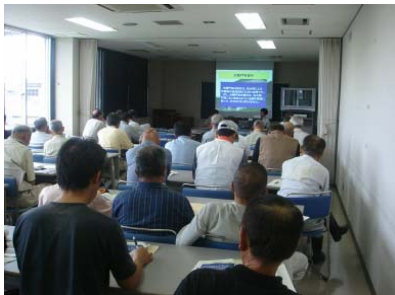
ゲート操作 及び点検 説明状況