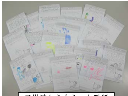
子供達からもらった手紙