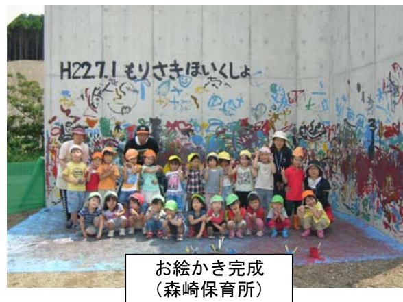
お絵かき完成 (森崎保育所)