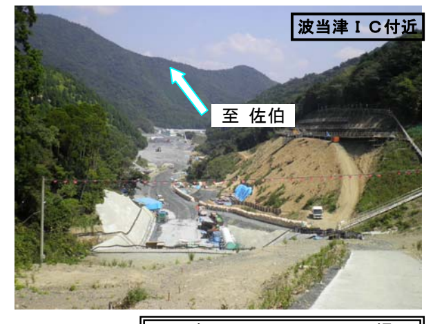
※写真についてはH22.9.17撮影