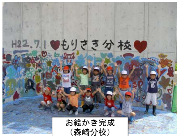
お絵かき完成 (森崎分校)