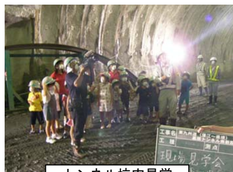
トンネル坑内見学

また、事前に採集しておいたクワガタ、カブトムシを、子供たちに渡すと満面の笑みで喜んでもらえました。また、見学会後に子供たちから、かわいい絵が入った手紙をいただき、「トンネルをどうやって作っているのかが分かった」、「また行きたい」との感想をもらいました。