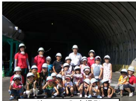
坑口での記念撮影