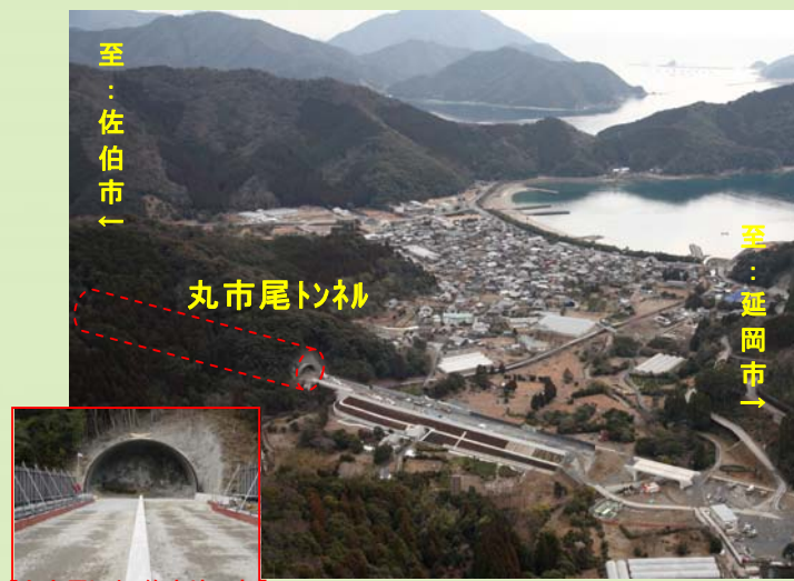
ちかくちやくと東九州自動車道の整備が進む丸市尾地区

2月21日（月）、佐伯市蒲江大字丸市尾浦地先において、蒲江～県境間で、最後に着手する丸市尾トンネル（334m）の安全祈願祭を施工業者主催で開催しました。