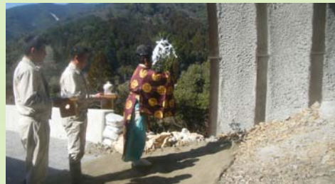
安全祈願祭の様子

「蒲江～県境」供用まであと2年あまり、無事故・無災害で無事にすべての工事を終了し、供用できることを祈願しました。