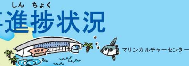
マリナルチャーターセンター