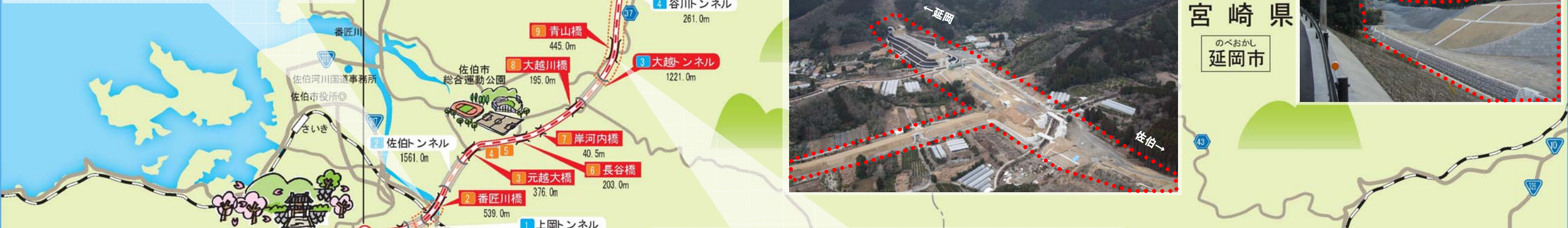
トンネル工事の進捗状況 H23. 2月末時点