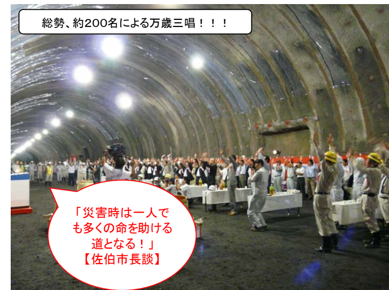
総勢、約200名による万歳三唱！！

式典後は会場の各所で互いの労をねぎらったり、肩を組んでの記念撮影など、たくさんの方々の記憶に残る貫通報告会となりました。