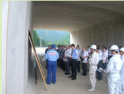
▲蒲江ICでの説明風景