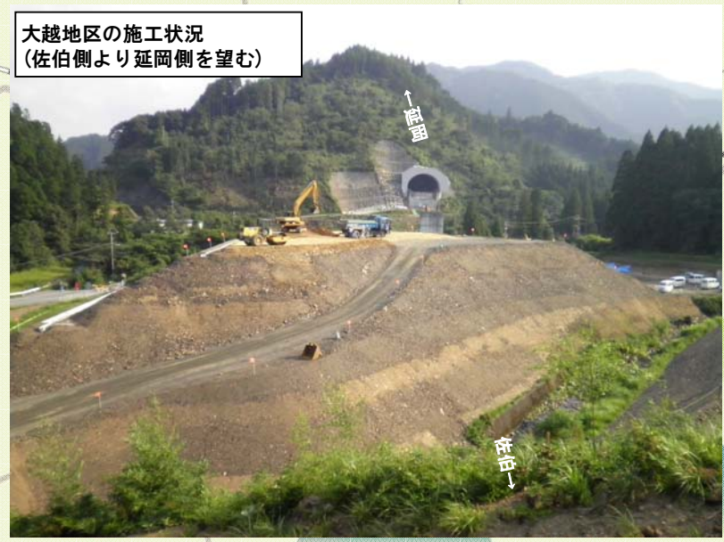
トンネル工事の進捗状況 H23.9月末時点