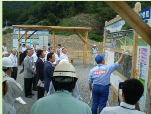
▲元越大橋での説明風景