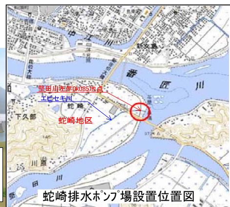
蛇崎排水ポンプ場設置位置図

機場形式:ポンプゲート 計画排水量:2.6m 3 /s 全揚程:2.7m ポンプ仕様:横軸水中ポンプ