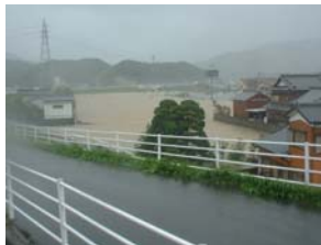
蛇崎地区内水被害状況(平成17年9月台風14号)