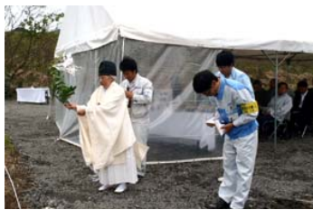
現地にて行われた安全祈願の様子