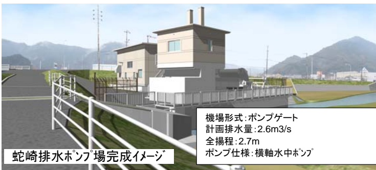
蛇崎排水ポンプ場完成イメージ

機場形式:ポンプゲート 計画排水量:2.6m 3 /s 全揚程:2.7m ポンプ仕様:横軸水中ポンプ