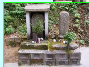
↑ 町指定文化財の「尾高智神社」 ← 佐伯惟治（1494～1527）の墓