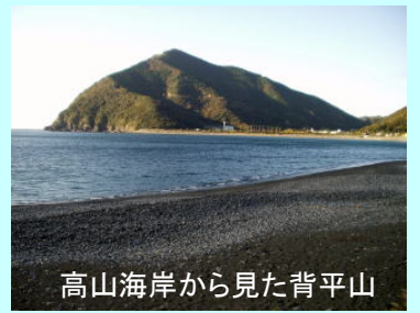
高山海岸から見た背平山