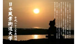
日本風景街道大学 平成二十三年一月

※詳しくは、「日南海岸きらめきライン」のホームページをご覧ください。 http://www.kirameki-line.com/