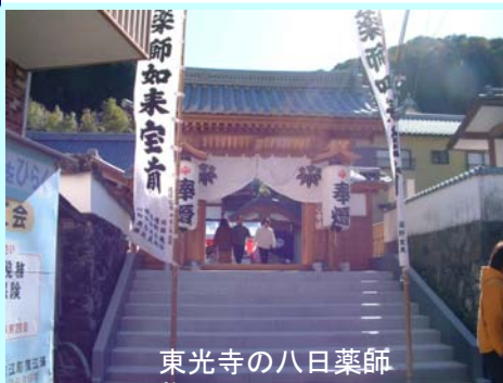
東光寺の八日薬師