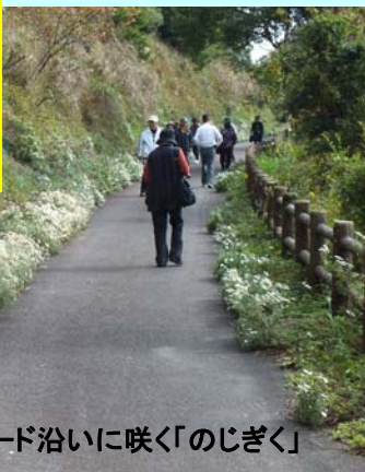
サイクリングロード沿いに咲く「のじぎく」