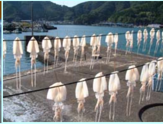
モイカ干しの風景