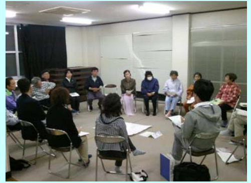
波当津地区の勉強会の様子

大分県や佐伯市の若手職員で構成する『県南ちえのわ会議』では、東九州自動車道の全線開通に向け、インターチェンジ(以下、IC)が設置される地区を中心とする住民の皆様と、IC開通後の地域のあり方について検討しています。例えば、波当津地区では、地区全体で「自然環境を活かした癒しのサービスエリア」はどうだろうか？など、活発な意見が出ており、区長さんを中心に‘地区の良いところの掘り起こし’や‘環境の保全’について勉強中です。10月には、熊本の阿蘇市、西原村に農村民泊等の先進地視察に行きました。