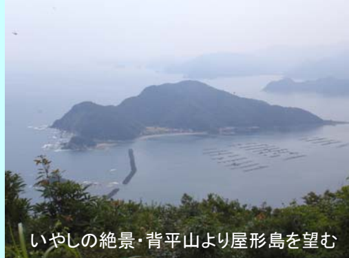
いやしの絶景・背平山より屋形島を望む

背平山は、佐伯市蒲江浦の東に位置し、標高392mの蒲江を象徴する里山です。昭和30年代までは山の中腹まで段々畑が続き、当時の主食であったイモや麦が植えられていました。