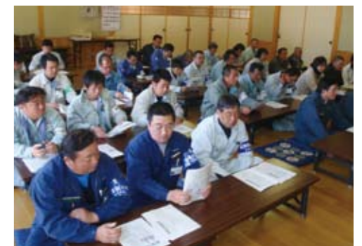
熱心に耳を傾ける隊員一同

「困った時はこのステッカーを貼った車に声をかけてね」と、ご家庭のお子さまたちに、どうぞ教えてあげて下さいね!