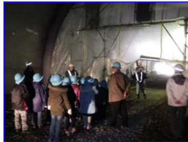
▲覆工中の森崎トンネル坑内見学