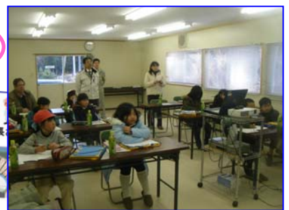
▲貫通した葛原・陣ヶ峰トンネルでおさらい