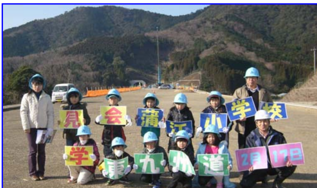
▲全貌が明らかになった蒲江インターチェンジで記念撮影

平成24年2月17日(金)、佐伯市蒲江の「蒲江小学校」の3年生10名と先生方が『東九州道蒲江IC～北浦IC区間の見学に来られました。