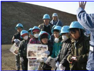
▲工事開始前の蒲江トンネル見学