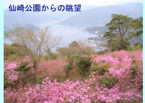
仙崎公園からの眺望