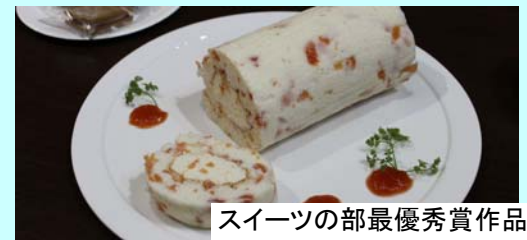
スイーツの部最優秀賞作品