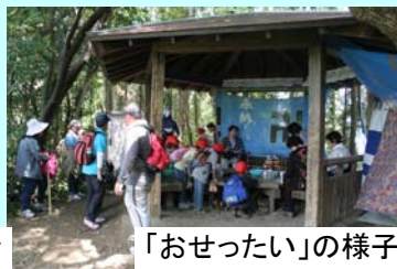
「おせったい」の様子