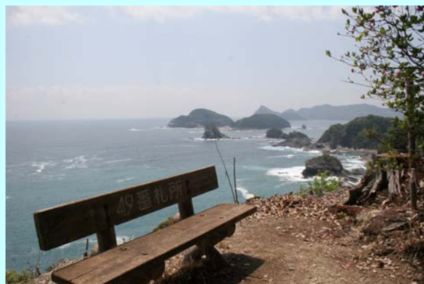
遍路道からの眺望