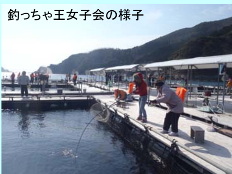
釣っちゃ王女子会の様子

釣り終了後は道の駅「かまえ」に移動して、新鮮な魚の刺身やカルパッチョ、サザエの炊き込みご飯などを堪能しました。