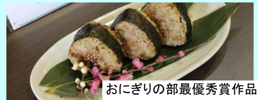
おにぎりの部最優秀賞作品