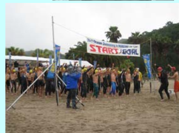
昨年のオーシャンスイミングinのべおか