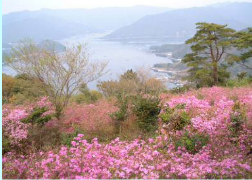
仙崎つつじ公園からの眺望

仙崎つつじ公園は、昭和55年から地区住民と行政が一体となって整備してきた公園で、今では多くの観光客が訪れる素晴らしい公園となりました。公園には5万株の「フジツツジ」が自生しており、4月中旬から下旬にかけて、あたりはピンクのじゅうたんになります。現在は、地元の「仙崎つつじの会」の皆さんが管理を行っています。