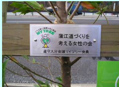
設置したネームプレート

3月10日、別大国道の6車線化を記念して、マイツリー植樹式が行われ、「浦江道づくりを考える女性の会」の皆さんが参加しました。当日は、25組の皆さんがいろいろな思いでマイツリーを植樹されました。