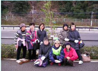
植樹したホルトノキと参加した皆さん