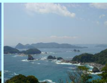
↑ 遍路道の眺望「海が青い」 ← 一番札所の「お大師さん」