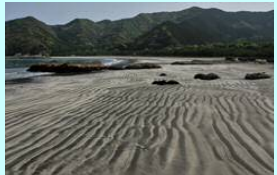
波当津海岸の砂紋

日豊海岸の春の風物誌に波当津海岸の砂紋があります。この季節、潮がひくとききれいな砂紋がよく見れます。3月20日、「春到来！蒲江でふわり癒し旅」波当津散策モニターツアーが開催されました。参加した人からは「波当津の大自然に癒された」、「地元の人との交流が楽しかった」などの声が聞かれ大満足のツアーとなったそうです。郷土料理おいしかったよ！！