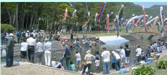
ニジマス釣り堀の様子