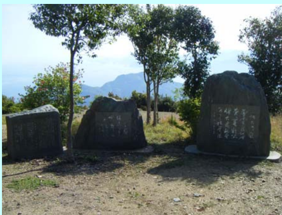
背平山「烽台晴嵐」の記念碑