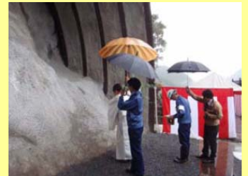
清 祓 の 議

工事の安全に気をつけて、一日も早い完成を目指しています。地域のみなさまのご協力をお願いします。