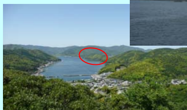
←たかひら展望公園からの名護屋鼻

河内湾と西浦湾を分ける名護屋鼻は、今の時期原生林が新緑を迎え、目に優しい風景を見せてくれます。