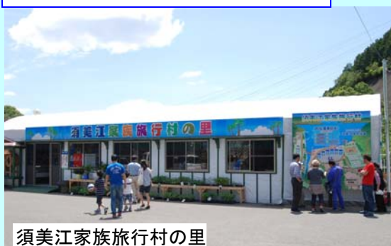
須美江家族旅行村の里