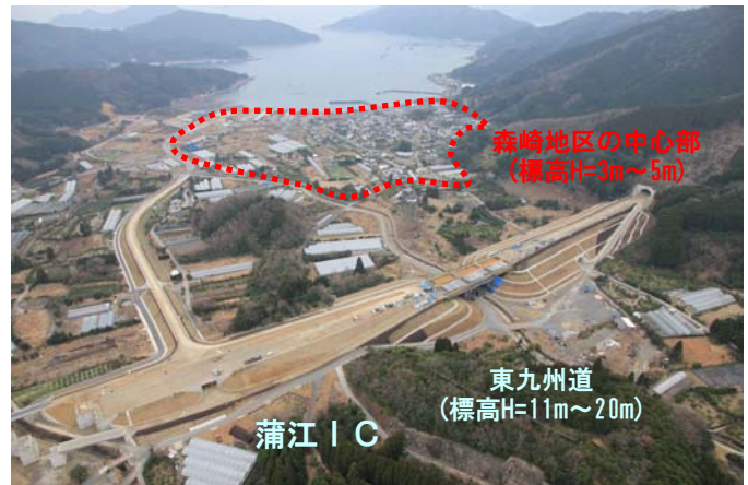
▲東九州道が通過する佐伯市蒲江の森崎地区