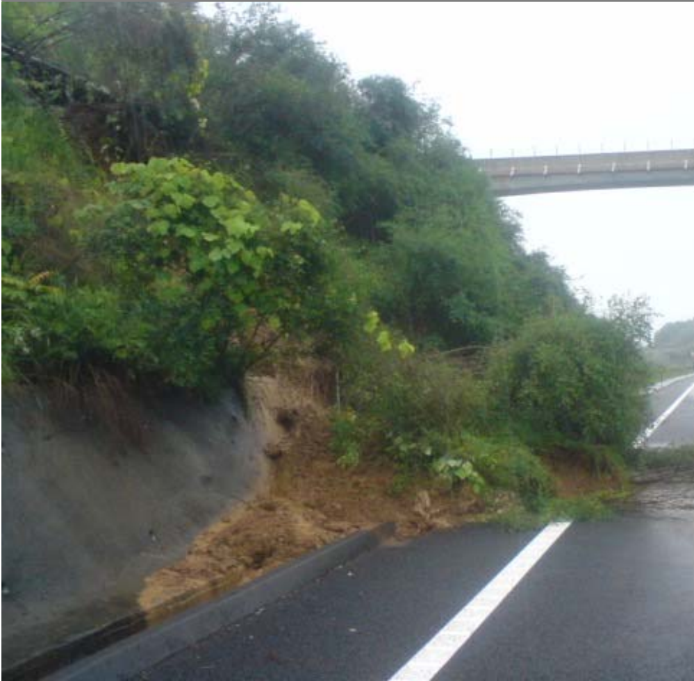
中九州横断道 大野東インターチェンジで発生した、のり面崩壊の状況(昨年6月12日)

昨年6月の豪雨で、中九州自動車道 大野東インターチェンジ付近では、道路のり面の土砂が崩落する被害が発生しました。今年も梅雨や台風時期を迎え、竹田維持出張所が万全の体制で挑む道路管理の取り組みについてご紹介します。