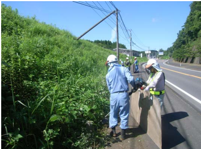
国道57号線 除草作業の状況(大野町)

また、期間中、箇所によっては道路通行規制を行います。大変ご迷惑をお掛けしますがご理解の程よろしく申し上げます。