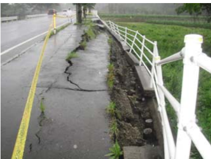
竹田市菅生で発生した歩道崩落(昨年6月12日)

今後も引き続き地域の皆様のご意見を伺いながら道路行政に反映していきます。まずは、 お気軽にご意見をお寄せ下さい。