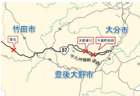
昨年度の被災箇所

豊後大野市・竹田市を通る国道10号・57号線は、地域の生活や経済・観光を支え、また災害時の防災支援ネットワークとして、重要な役割を担っています。しかし、昨年度は梅雨時期の長引く大雨の影響で国道57号線が3箇所にわたって被災し、道路利用者の皆様に対し安全・安心・快適な道路サービス提供ができない状況に陥りました。