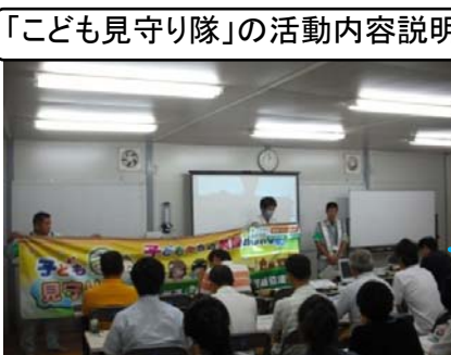
「子ども見守り隊」の活動内容説明