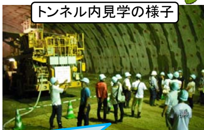
トンネル内見学の様子

その後、120mほど掘削が進んでいるトンネルの中に入り、使用している機械・トンネル内の構造等を説明すると、先生方が子供のように興味深く話を聞いておられました。