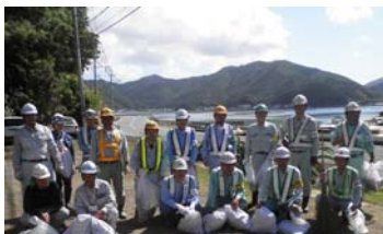
▲越田尾地区道路一斉清掃の様子