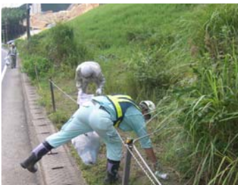
▲三軒屋地区道路一斉清掃の様子

平成24年7月31日(火)、佐伯河川国道事務所が発注した東九州道の工事受注業者で構成された「佐伯南地区工事連絡協議会」(21社)は、工事車両の通過が多く、協力いただいている三軒屋地区・越田尾地区の一斉清掃を実施しました。 猛暑の中、約25名によるゴミ拾いと、道路清掃を行いました。