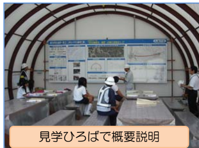
見学ひろばで概要説明

実際の工事で使用する資材(鋼製支保工)への記念サインやトンネル掘削時の発破音を聞き、日頃出来ない体験をしました。