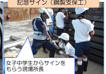
記念サイン(鋼製支保工)