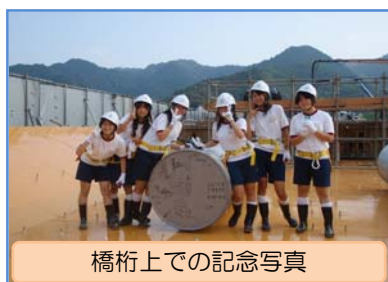
橋桁上での記念写真