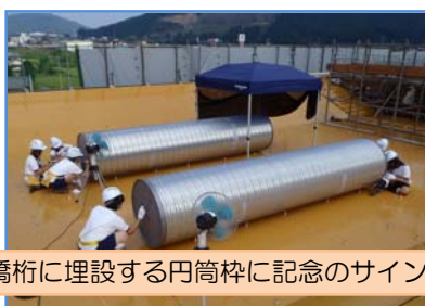
橋桁に埋設する円筒枠に記念のサイン