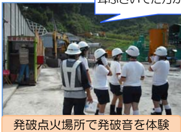
発破点火場所で発破音を体験

番匠川橋では慣れない手つきで安全帯を装着した後、約1.5mの昇降通路を息を切らしながら登り、桁上の景色と涼風に感激していました。