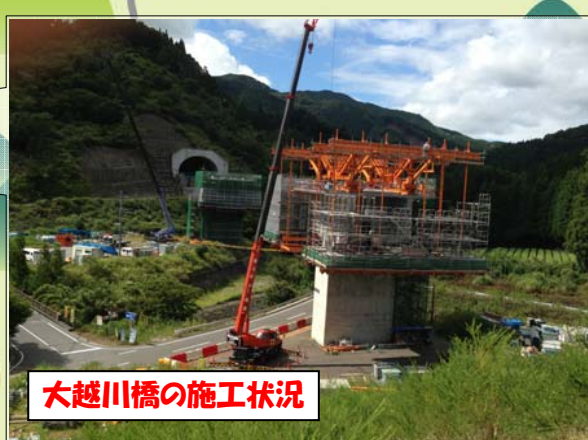
大越川橋の施工状況