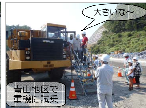
青山地区で重機に試乗