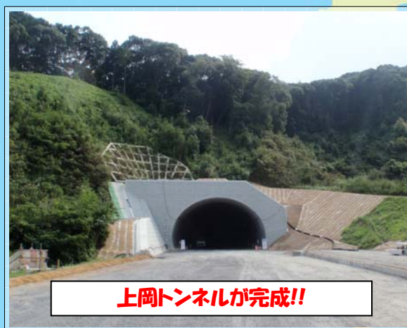
上岡トンネルが完成!!