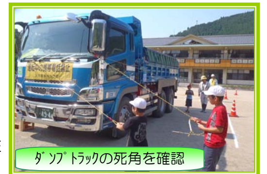
ダンプトラックの死角を確認

この取組は、東九州道の工事で通学路を工事車両が多く通行することや夏休みに子供達が自転に乗る機会が増えることなどから企画されました。当日は暑い中、青山小児童18名の他、先生方、佐伯警察署堅田駐在さん、青山地区住民など約30名が参加しました。