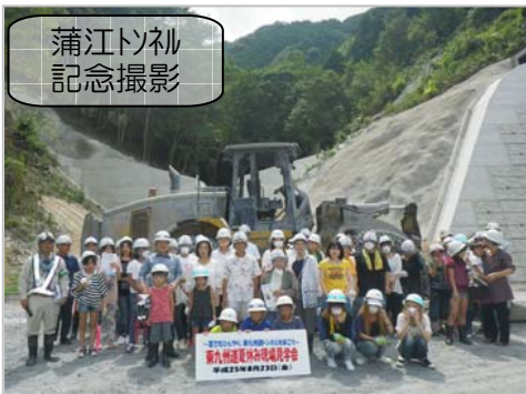
蒲江トンネル記念撮影

参加した家族からは、「大変な仕事と感じた」「汚れて帰ってくるもの納得」「こんなでっかいトンネルを作るおとうさんは凄い」などの感想が聞かれました。