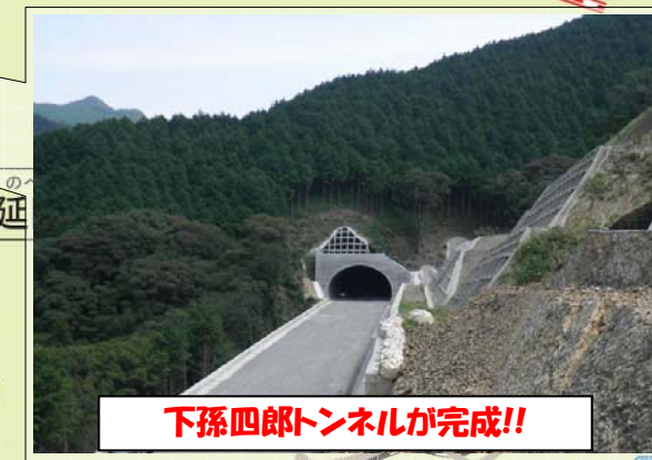
下孫四郎トンネルが完成!!