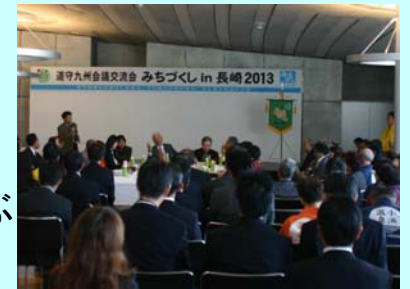
パブリックミーティングの様子

11月1日に道守(みちもり)九州会議交流会の「みちづくしin長崎」が開催されました。本会は、九州の道のボランティアの集いで、佐伯から”蒲江道づくりを考える女性の会”他8名が参加しました。交流集会では、カラフルな大漁旗の衣装や伊勢えびのかぶり物、地元の特産品等も持ち込み蒲江のPRも行いました。来年度は大分での開催となります。