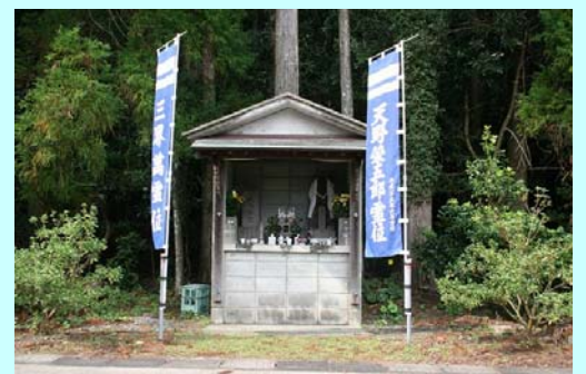
旧388号沿いにあるお堂

また、お墓(延岡市北浦総合支所前)から北方300mの国道388号線西側の村落のはずれに天野権現として祀られた天野神社があります。