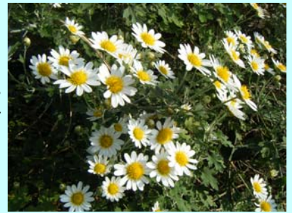
のじぎく (H25. 11. 9撮影)

11月17日(日)は里の駅 たかひら展望公園で、のじぎく祭が開催される予定です。