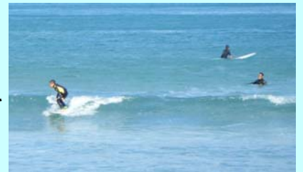
よく見ればちびっ子サーファー

日本の白砂青松百選に選ばれた、美しい海岸の波当津海岸は夏は海水浴、オフシーズンにはサーフィンとマリンスポーツを楽しめます。たまたま訪れた日は約20人のサーファーが波を楽しんでいました。駐車されている車は大分ナンバーの車が多かったですが中には熊本や福岡ナンバーの車もありました。