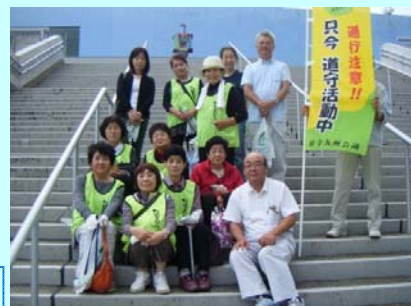
蒲江道づくりを考える女性の会の皆さん

10月11日（土）、高崎山おさる館で「道守大分会議」の総会があり大分県の道守さん約30名が集まり活動報告や意見交換、別大国道の清掃を行いました。蒲江地区からも「蒲江道づくりを考える女性の会」の皆さん9名が参加しました。別大国道には全国でも珍しいマイツリーが植えられており、女性の会のマイツリーも順調に育っていました。