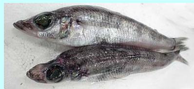
「メヒカリ」(アオメエソ)

味は淡泊で骨が柔らかく、唐揚げを始め、姿焼きや南蛮漬けなど地域の郷土料理として親しまれています。