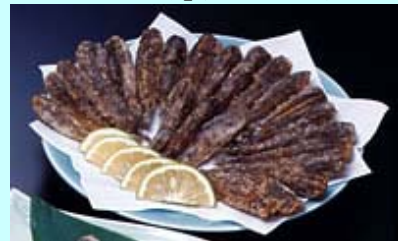
「メヒカリ」の唐揚げ