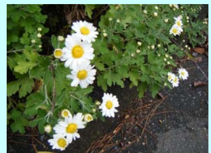
のじぎく (H26. 11. 2撮影)