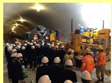
見学する延岡工業高校の生徒さん

東九州道（佐伯～蒲江）の野々河内地区で行われている、アスファルト舗装、コンクリート舗装工事では、施工の効率化、施工精度の向上、品質の向上をはかるため、情報化施工に取り組んでいます。13日には延岡工業高校の生徒が見学にこられ、17日は三川内中学、20日豊南高校の生徒も見学の予定です。