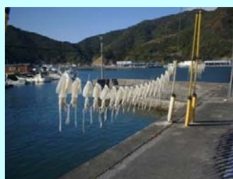
「モイカ」干しの風景

モイカは、冬のイカの王様で新鮮な刺身は肉厚で甘味が濃く美味しい一品です。また、一夜干しもあり、ご飯のおかずにも、お酒のつまみにおすすめです。