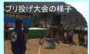
ブリ投げ大会の様子