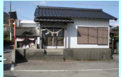
北浦町総合支所前の「お堂」

◆ 東光寺の八日薬師祭(佐伯市蒲江) 蒲江ICから車で10分 東光寺本堂に隣接する薬師堂には、応永13年(1406年)に西野浦の海中から引き揚げられたと伝えられる薬師如来像が安置されています。薬師如来は近隣の漁師たちに「海の守護仏」として信仰が厚く、毎年1月8日の八日薬師祭には多くの参拝者で賑わいます。昔は、延岡方面からの参拝魚船で港がいっぱいになったようです。写真は昨年夜の写真で、提灯などで境内を明るくして、お参りされる方を迎えていました。