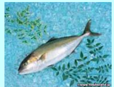
ほろ酔いカンパチ

通常捨ててしまう焼酎搾り粕の廃棄コスト、養殖コストの低減、さらに魚自体の付加価値向上など環境に優しく、大変美味しいお魚です！