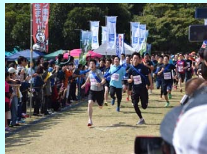
昨年(H27.3.21)開催時の様子 ゴール付近でのデッドヒート

開催日時:平成28年3月13日(日)10:00～14:30 場所:須美江家族旅行村(須美江ICから車で5分) (延岡市須美江町1450-2 TEL:0982-43-0201) (大会公式ホームページ: http://taikai.in/hkrm-nobeoka/ )