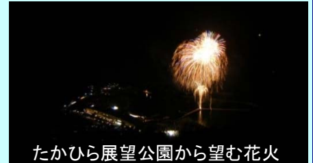
たかひら展望公園から望む花火

昨年とはとても寒かったので防寒対策をしっかりと、冬の澄んだ空気の中で鮮やかにひらく花火を楽しんで下さい。