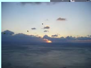
雲海から差し込む光