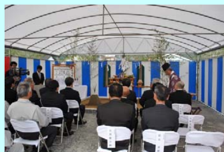
安全祈願祭の様子

ゴールデンウィーク前のオープンを目指し、工事が進められており、延岡市の新たな北の玄関口としての役割が期待されています！！