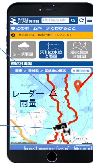
スマートフォン版