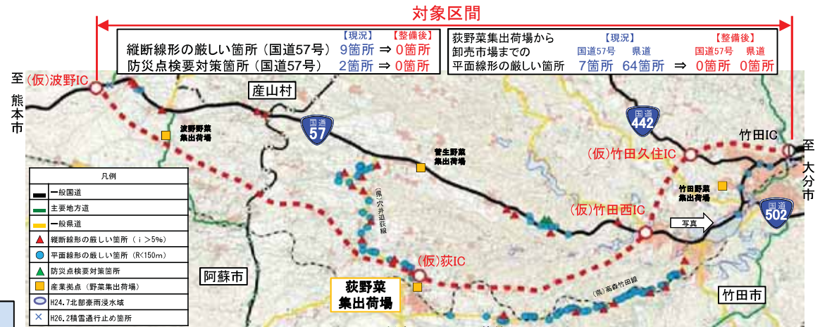
▲対象区間の現道状況