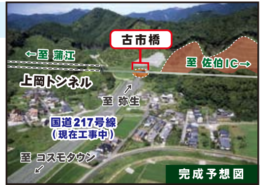
上の写真の [ ] の部分が工事箇所です

現在工事は掘削工事と下部工工事を並行して行っており、毎日20台近くの大型トラックで、土砂を岸河内地区等の工事現場に運搬しています。土砂の運搬にあたっては、地元の皆様や一般車両にご迷惑をおかけしないよう、細心の注意を払って作業を進めています。