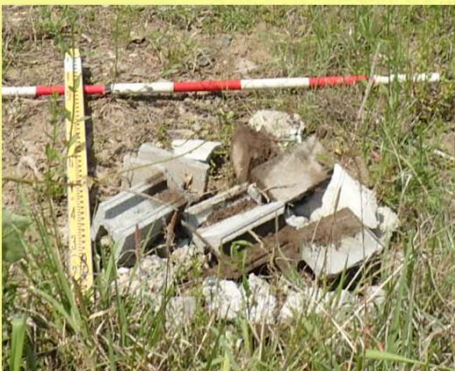
平成30年5月16日発見 番匠川右岸 稲垣橋下流（コンクリート殻）