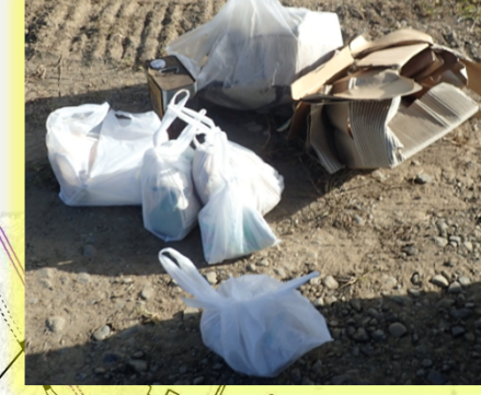
平成30年10月19日発見 番匠川左岸 稲垣橋下流（殺虫剤・オイル缶）