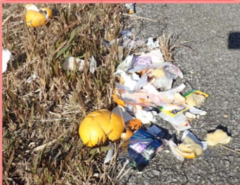
平成30年12月28日発見 堅田川右岸 国・県管理境付近（家庭ゴミ）