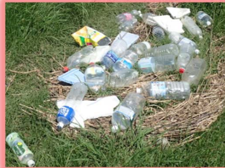
平成30年7月13日発見 井崎川右岸 山王公園かっぱ橋（ペットボトル）