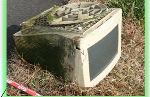
平成31年2月6日発見 番匠川河道内 自動車学校裏付近（PCモニター）