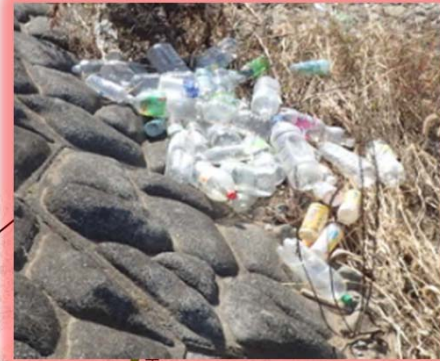
平成30年10月29日発見 井崎川左岸 10号線植松橋上流（ペットボトル）