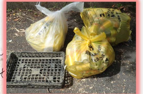
平成30年7月20日発見 番匠川右岸 上灘地区（大量の空き缶入りの袋）