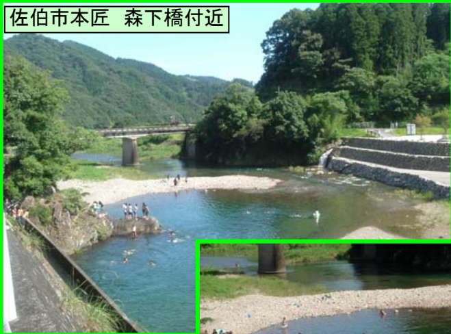
佐伯市本匠 森下橋付近