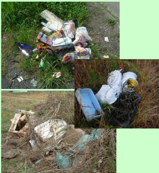
過去の不法投棄状況写真

昨年佐伯市女島地区の堤防でゴミの不法投棄が発見されました。投棄者は書類送検され、罰金はもちろん、社会的制裁を受ける事となりました。 出張所では、今後も河川巡視や看板設置などにより不法投棄の防止に努めていきたいと考えておりますが、地域住民の皆さんにも目を光らせていただきゴミを捨てにくする等、1人1人の協力が必要不可欠です。 力を合わせて美しい番匠川を守りましょう。