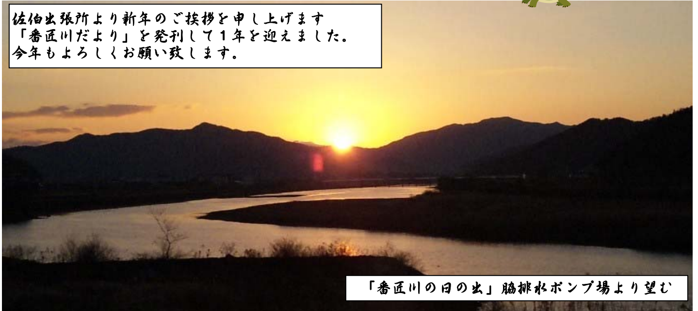
「番匠川の日の出」脇排水ポンプ場より望む

佐伯出張所より新年のご挨拶を申し上げます 「番匠川だより」を発刊して1年を迎えました。 今年もよろしくお願い致します。