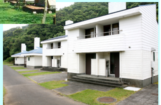
須美江家族旅行村のケビン

須美江海岸で海水浴が楽しめます。 ケビン：12棟 常設テント：14張 オートキャンプ：15区画