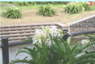
下阿蘇浜木綿村のハマユウ

下阿蘇ビーチが目の前に広がるキャンプ場です。 ケビン：15棟 常設テント：11張 オートキャンプ：12区画