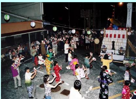
写真は佐伯市蒲江浦の盆踊り