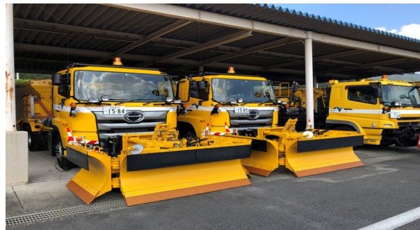
湿塩散布車（除雪機能あり）