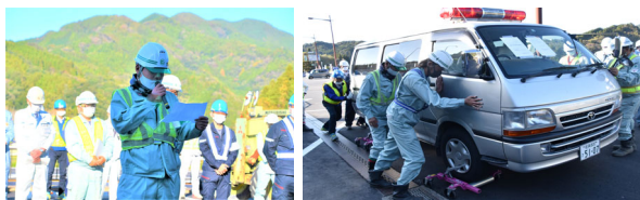
スタック車両対応訓練（ゴージャッキ）