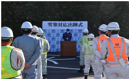
主催者挨拶、安全宣言