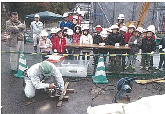
建設資材の切断見学(イメージ)