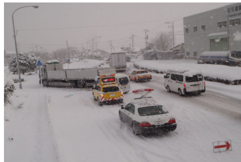
スタック車両対応