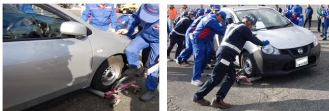
スタック車両対応訓練