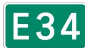
長崎自動車道 大分自動車道 （日出～鳥栖）