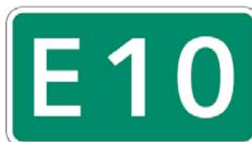
東九州自動車道 （北九州～清武）