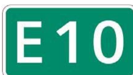
東九州自動車道 （北九州～清武）