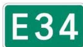
長崎自動車道 大分自動車道 （日出～鳥栖）